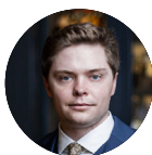
Filip Emmer Analytik CZECH FUND

Akvizicí kancelářské budovy Signum fond započal novou kapitolu. Po divisticích nemovitostí na Chodově a Černém Mostu chybělo CREIFu aktivum, které by mohlo profitovat z dynamiky metropole. Investicí v polském hlavním městě CREIF tuto mezeru vyplnil a zašel o krok dál v diverzifikaci portfolia, kdy investoři ve fondu budou výnosově těžit z nového odvětví, přestože sebou přináší i dlouhodobé výzvy, kterým bezesporu bude nutno čelit.